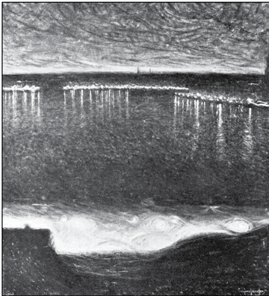
Eugène Jansson: Utsikt öfver Riddarfjärden, sen höstkväll. Oljemålning