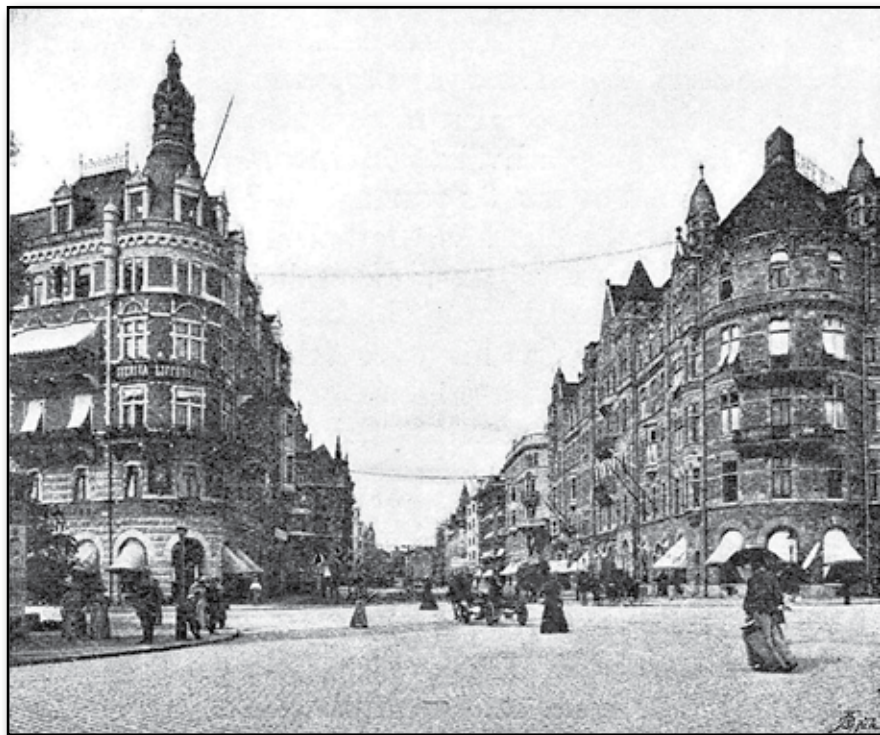
Stockholm: Birger Jarls-gatan.