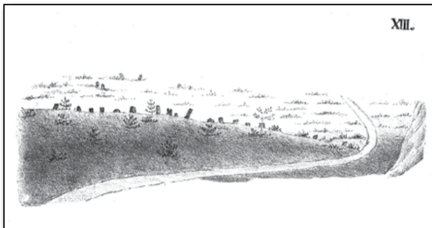
Stensättning i Bohuslän.