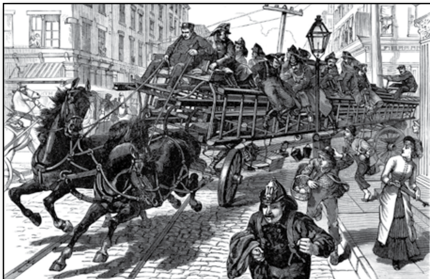
Brandväsendet i New-York. En till brandväsendet hörande vagn, afsedd för brandstegar och diverse släckningsredskap.