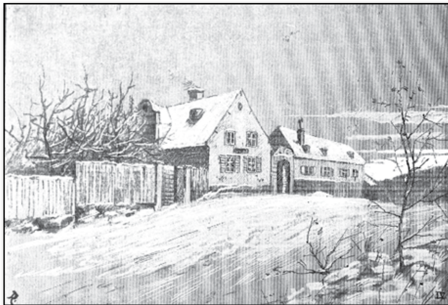
BELLMANSMINNEN. IV. Ingemarshof vid Roslagstull (före dess restaurerande). Tecknade af HENRIK REUTERDAHL.