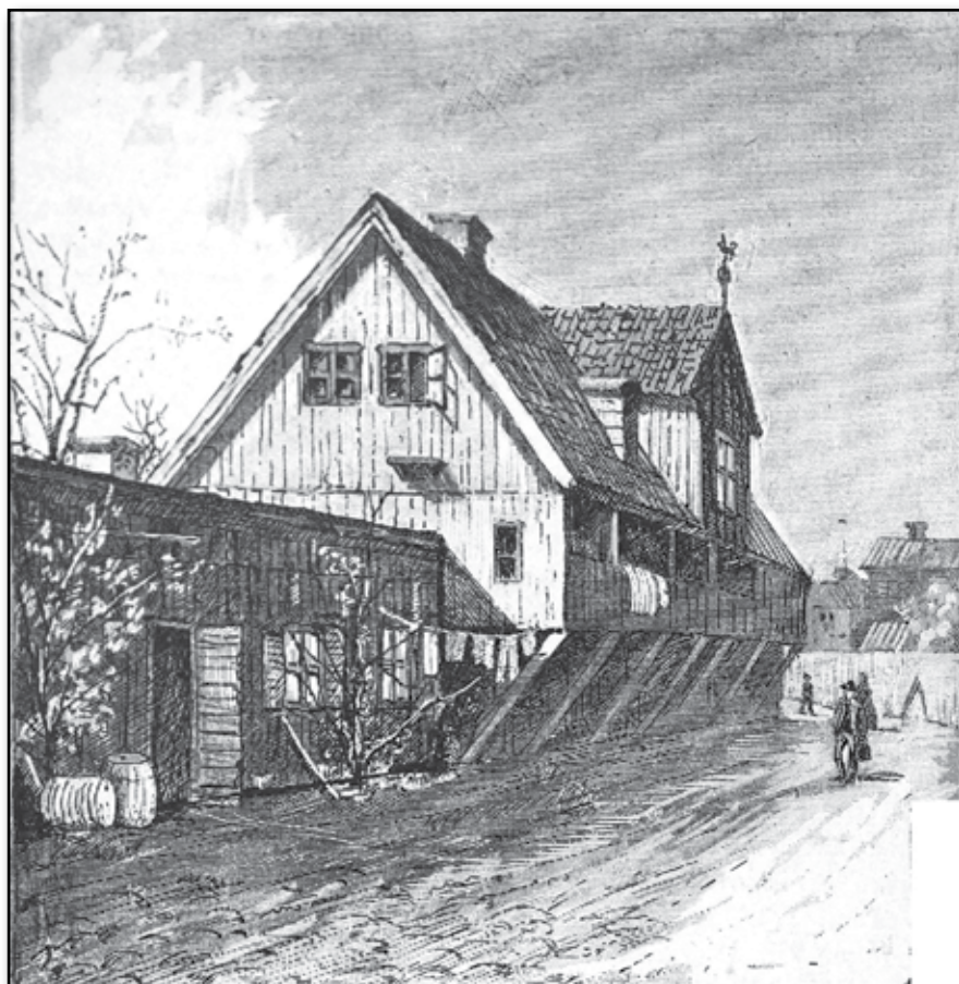
BELLMANSMINNE . I. Gröna Lund på Djurgården. Tecknade af HENRIK REUTERDAHL.