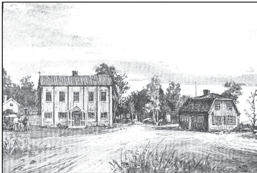
BELLMANSMINNEN. III. Hagalunds värdshus vid Haga. Tecknade af HENRIK REUTERDAHL.