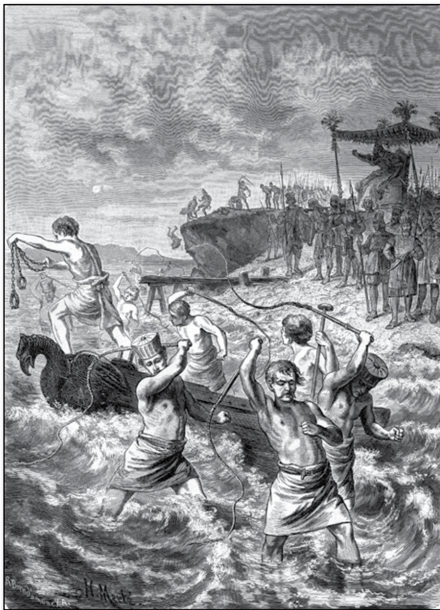
Xerxes låter piska hafvet.