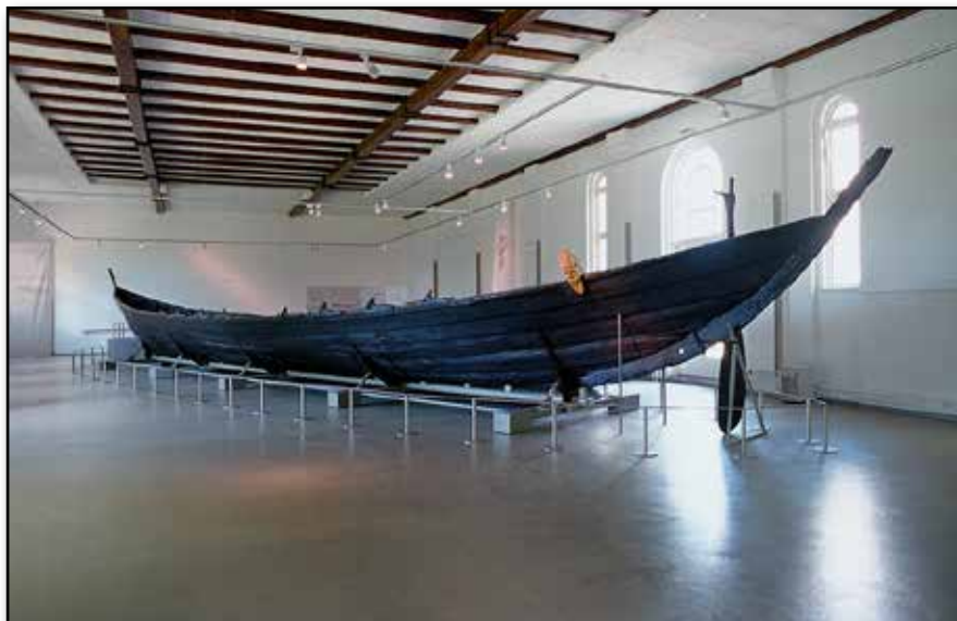
Nydam-skeppet på museet i Schleswig.