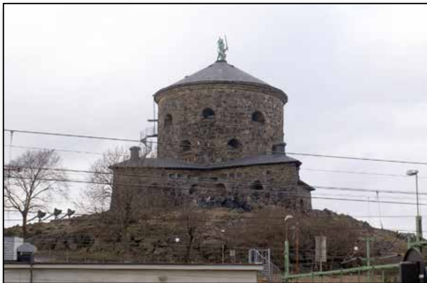
Befästningen Vestgöta Lejon i dag.