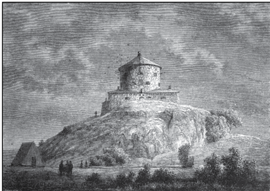
Skansen "Lejonet" vid Göteborg.