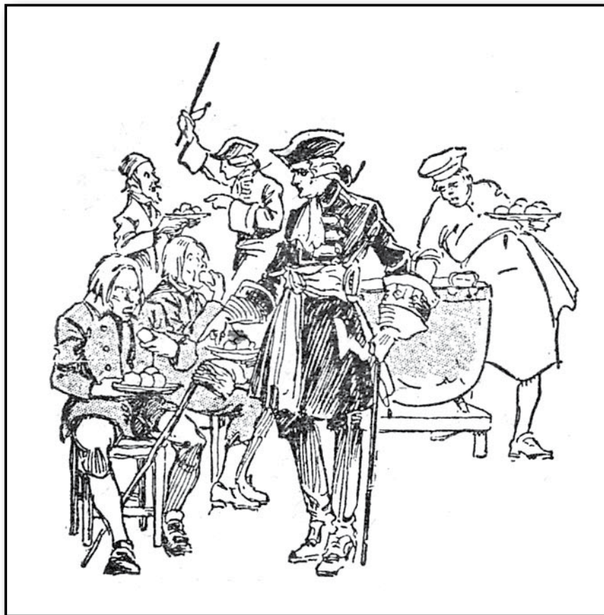
De preussiska bönderna lära sig att äta potatis.