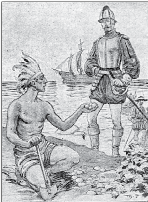
Då spanjorerna första gången sågo potatisen.