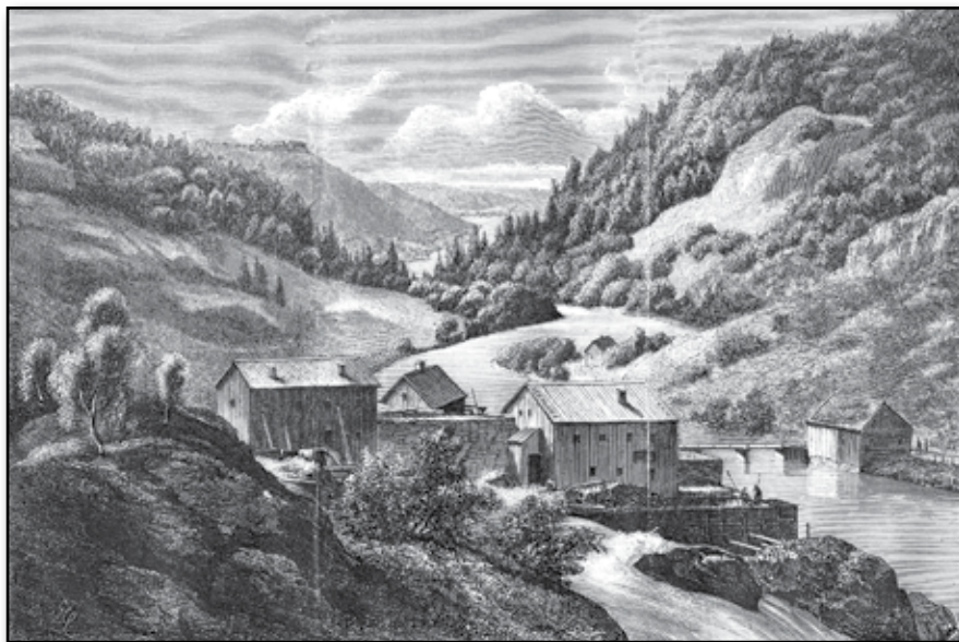
Utsigt af Tistedalen vid fästningen Fredrikshald i Norge.