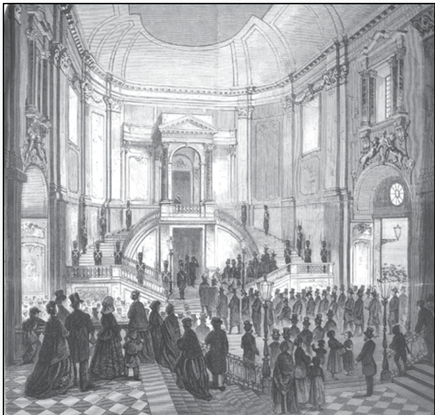
FRÅN STOCKHOLMS SLOTT. Uppgången till Rikssalen i södra slottshvalvet, d. 18 jan.: Kamrarnes procession från Storkyrkan till rikssalen. Tecknad af O. MANKELL och A. HAFSTRÖM.