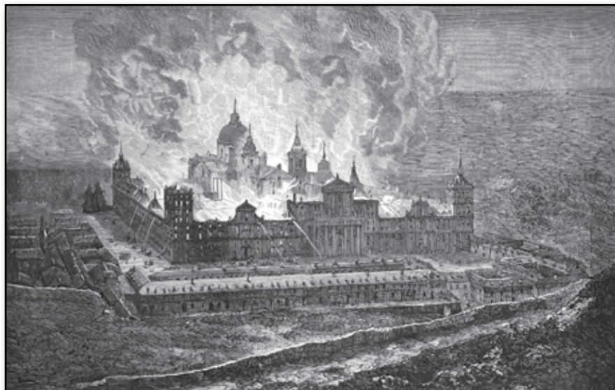
Från Spanien: Branden i slottet Escorial. Efter fransk teckning.