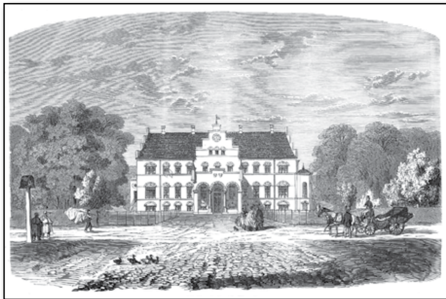
Valbygård vid Slagelse.