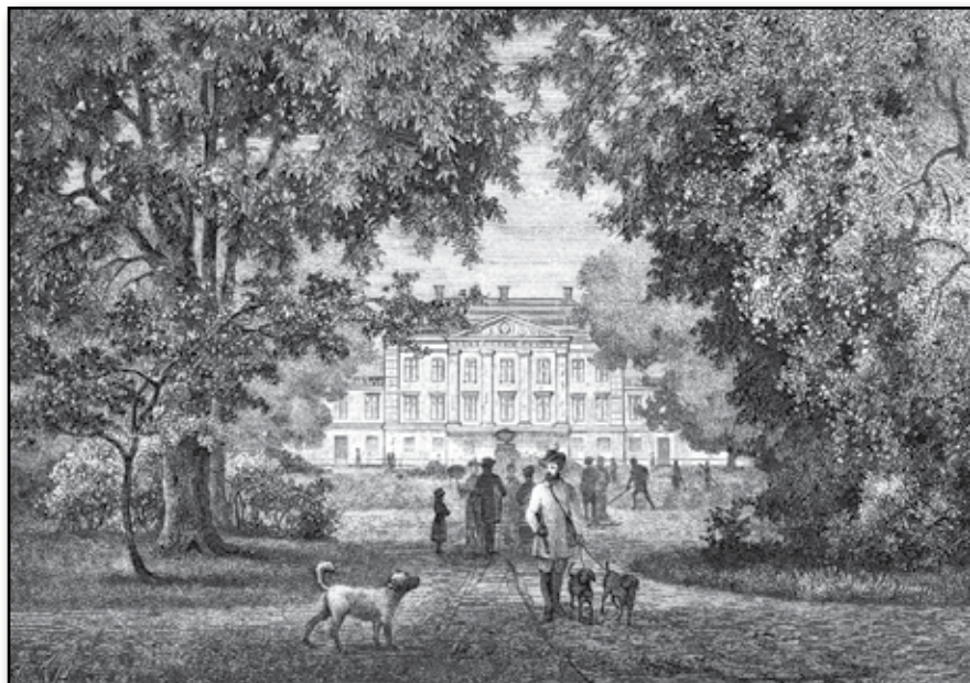
Hellekis på Kinnekulle.