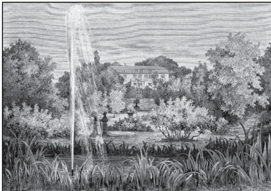
Råbäck på Kinnekulle.