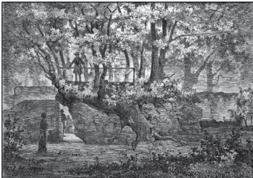
Sandstengrottan och "apostla-almen" vid Råbäck på Kinnekulle.