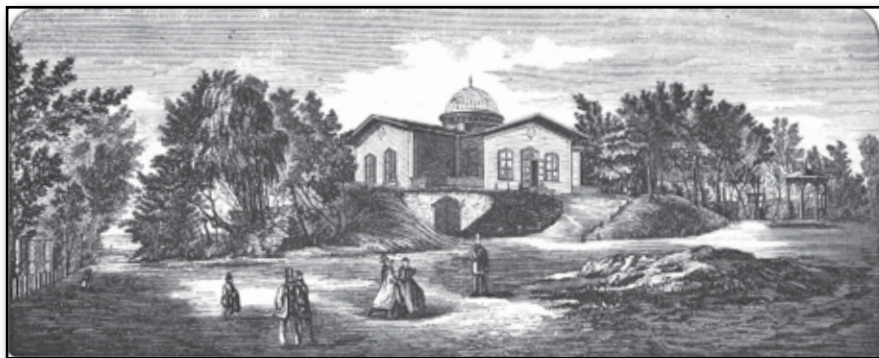
Vy af Öfra Tivoli i Halmstad.