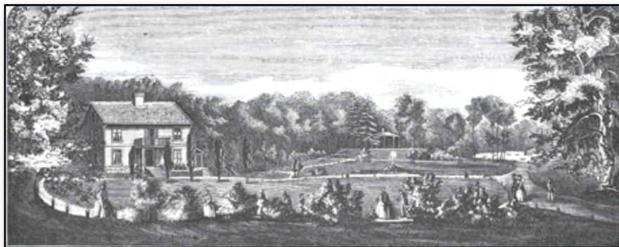
Vy af Nedra Tivoli i Halmstad.