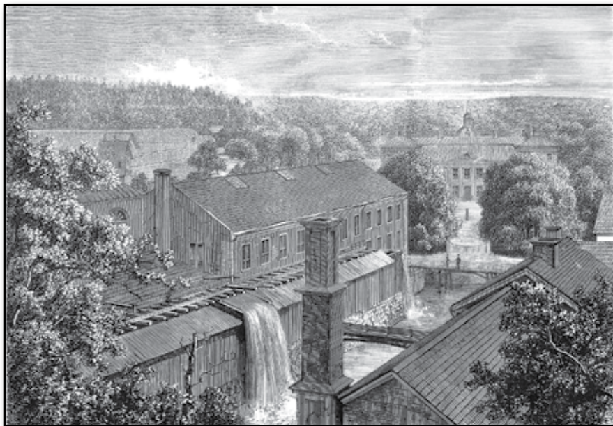
Finspongs kanongjuteri vid Norrköping.