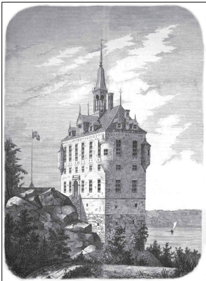
VIKS SLOTT I UPPLAND. Restaurerad efter ritning af F. W. Scholander. Tecknad på trä af M. ISÆUS.