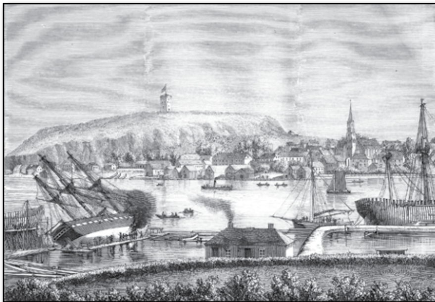
Tönsberg med Slotsbjerget, sedt från skeppsredaren Bulls villa "Fagerheim".