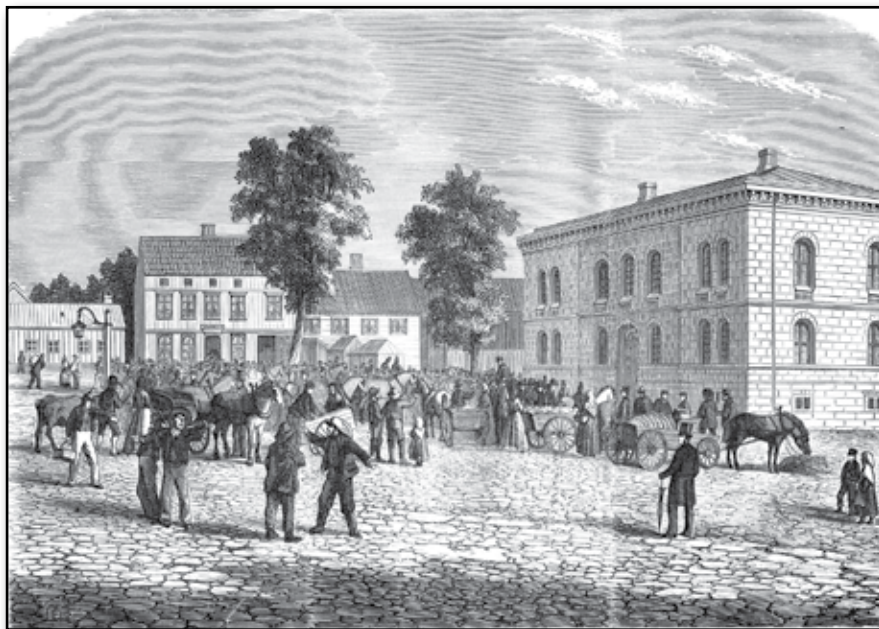
Parti af torget i Tönsberg med dess nya rådhus.