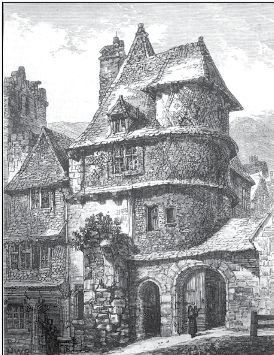
Stadsport i Morlaix. Efter engelsk teckning.