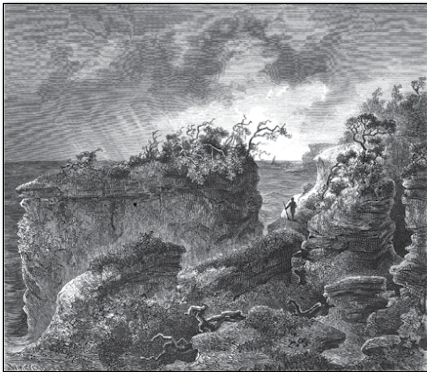
Rölfvar Liljas håla.