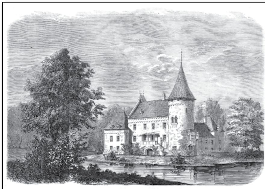
Herregården Örtofta i Skåne.