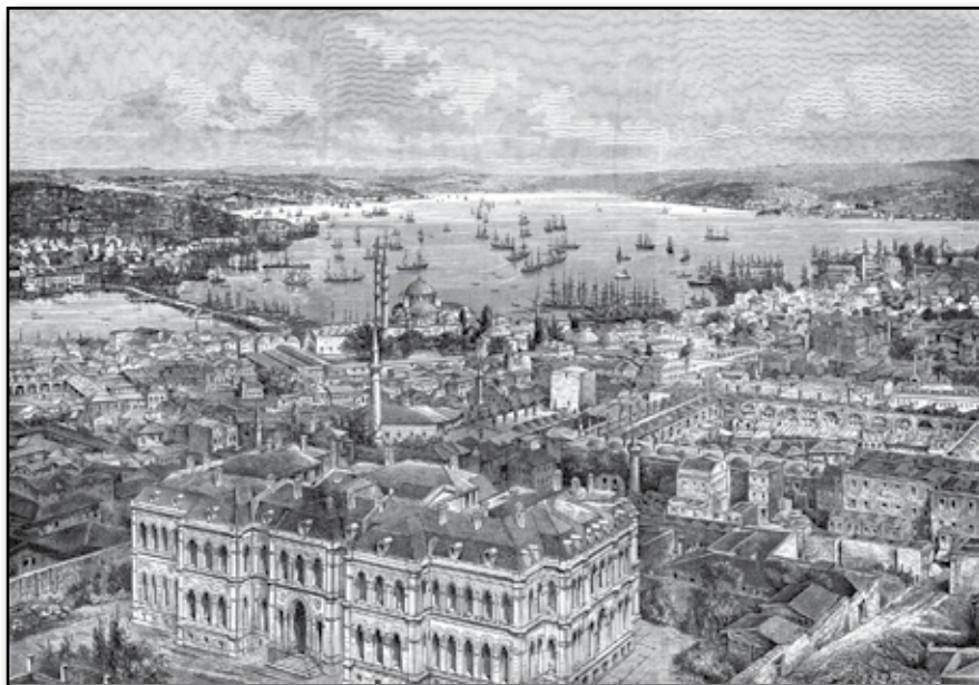
Konstantinopel. Tecknadt af H. Nisle efter en fotografi.