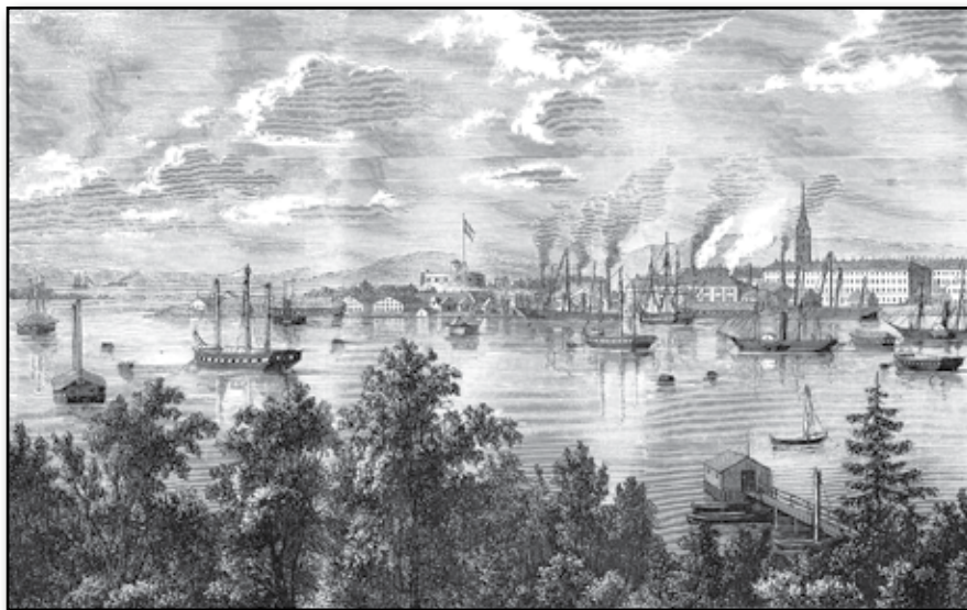
Inre Horten med Karl-Johansvärn vid Kristianiafjorden.