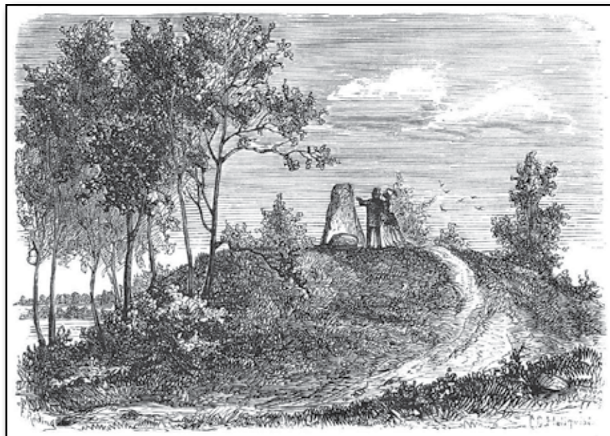
Inglinge Hög. Ett fornminne i Småland, tillhörigt Svenska Fornminnesföreningen.