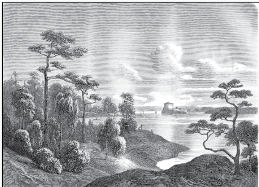
Badorten Dalarö i Stockholms Skärgård.