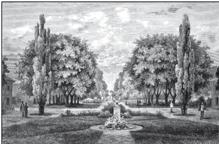
Gårdsplanen vid Dagsnäs.