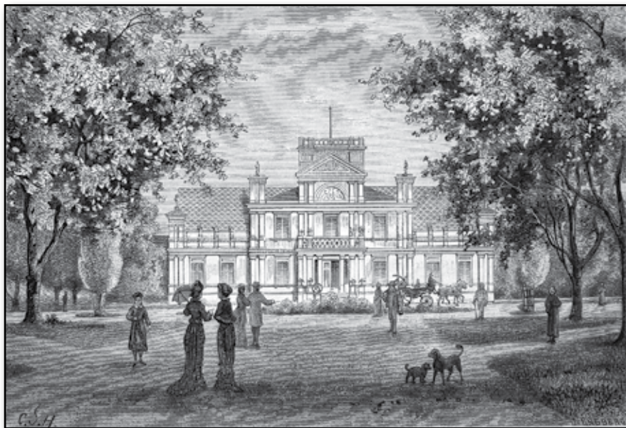
Dagsnäs sedt från gårdsplanen.