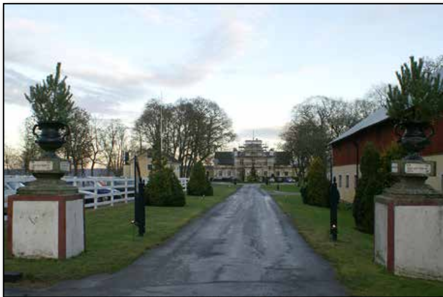
Det moderna Dagsnäs slott. Foto från 2008.