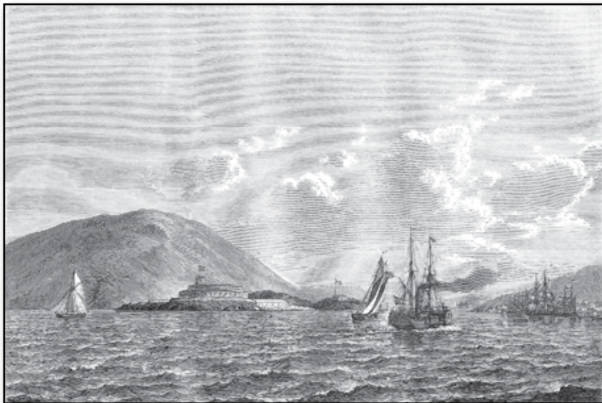
Kaholmarne vid Dröbak i Kristianiafjorden.