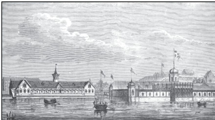
Nya badhuset i Varberg.