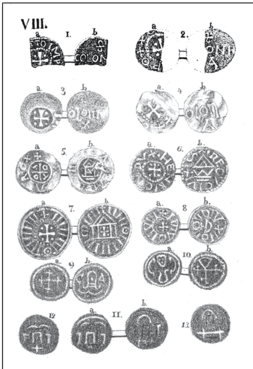
Gamla mynt, funna i Skåne år 1816.