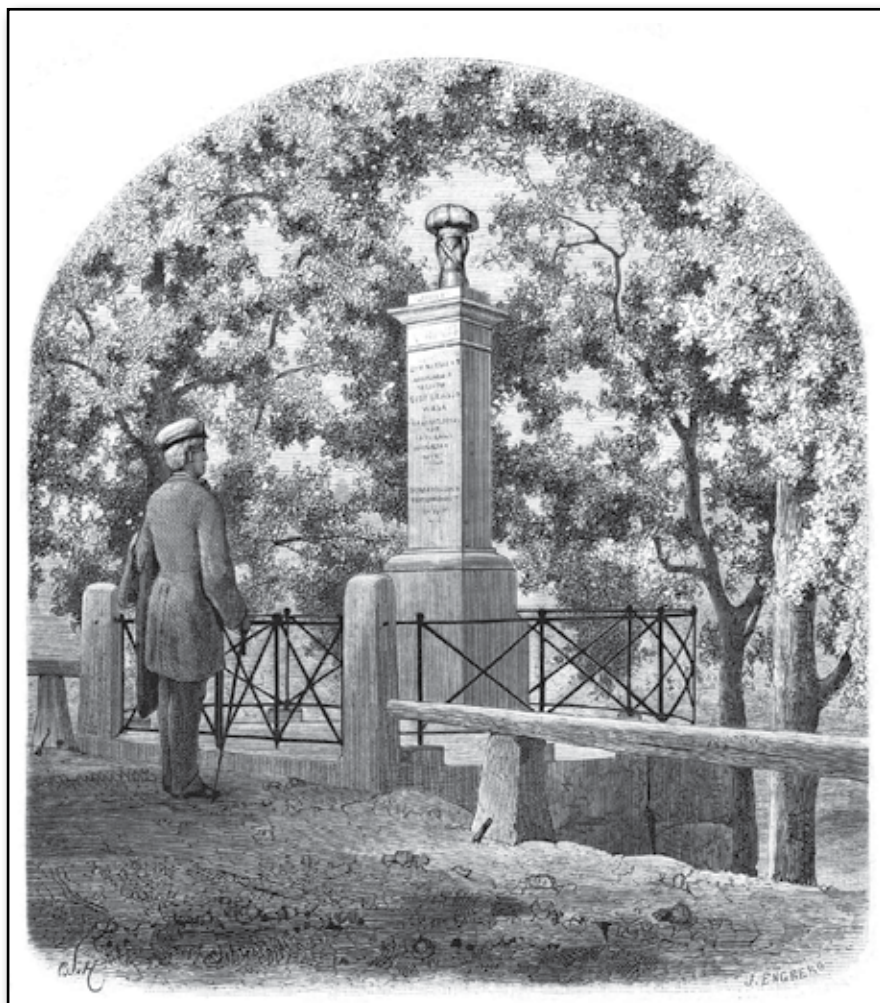
Wasa-monumentet vid Läby vad.