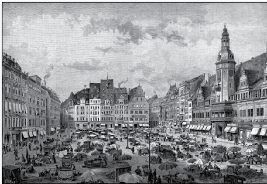
Marknadsplatsen vid rådhuset i Leipzig.