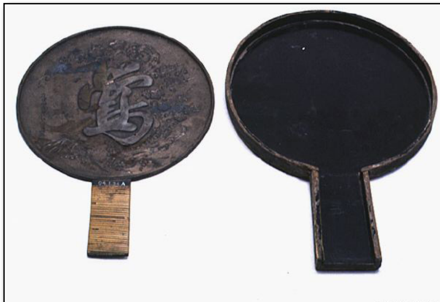
Trollspegel från Japan på Etnografiska museet i Stockholm.