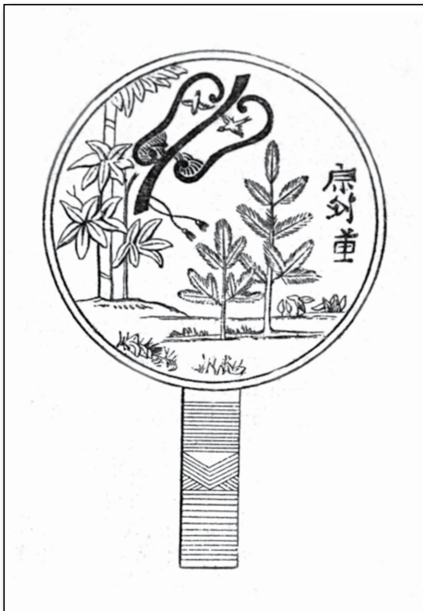
Japansk trollspegels baksida.