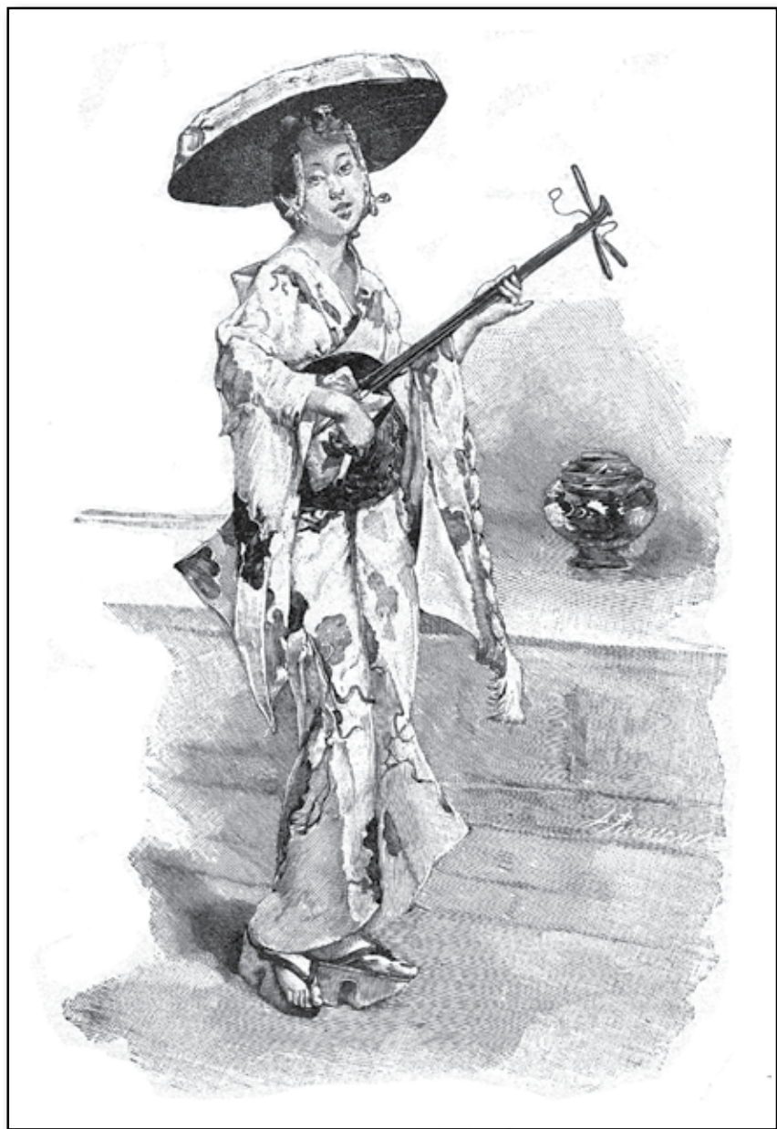
En geisha, japansk danserska.