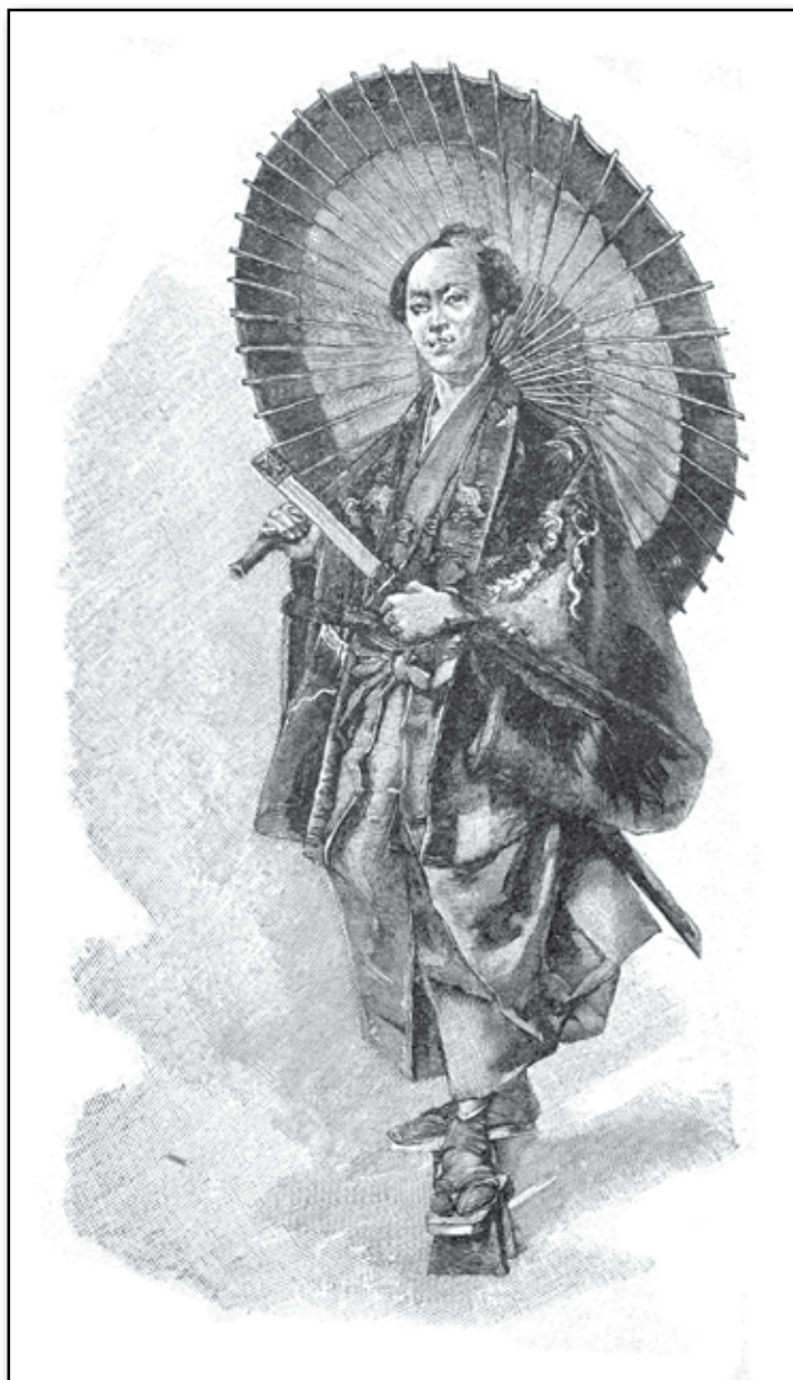
En samurai, japansk krigare.