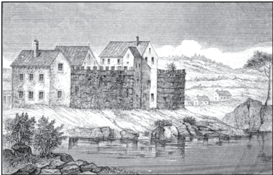
Kastelholms slott vid slutet af 17:de århundradet.