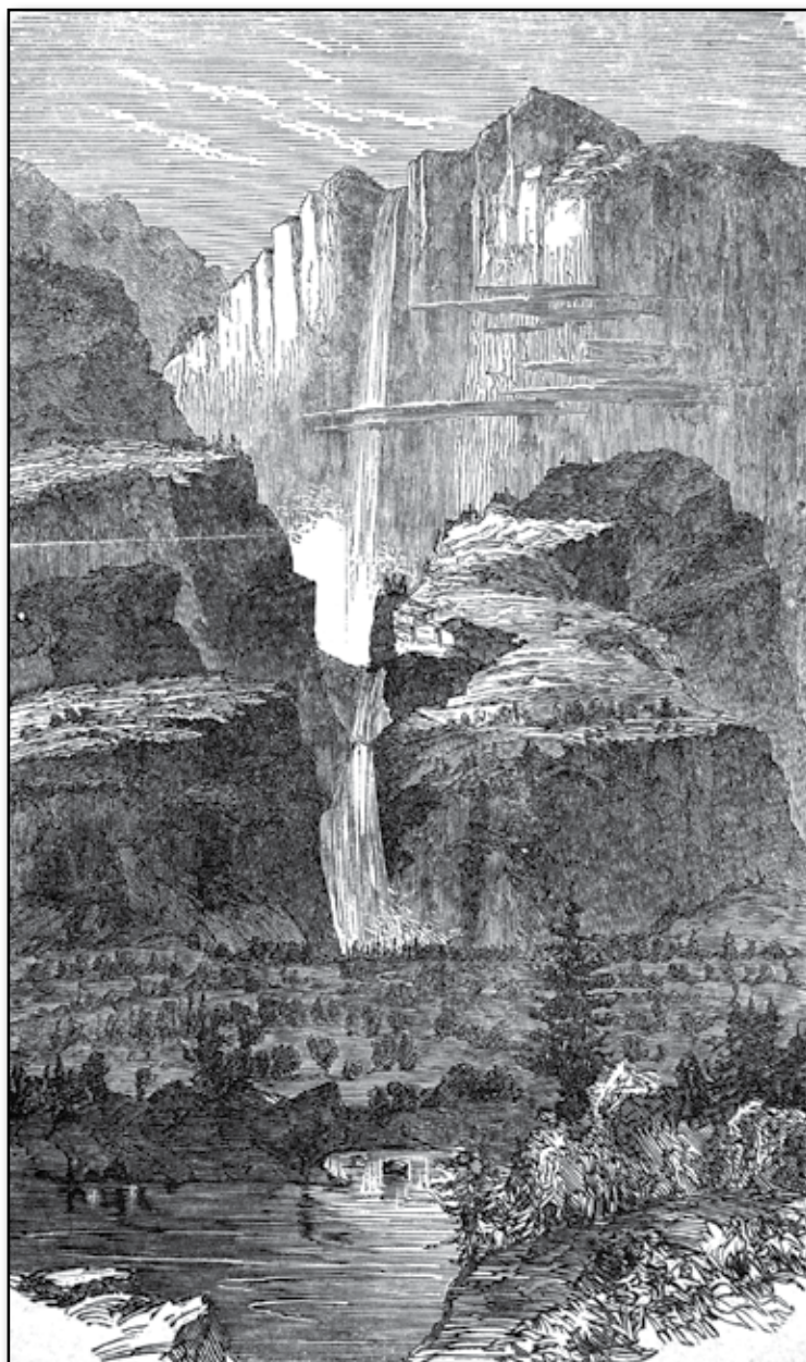
Schuluk-fallet i Josemittedalen.