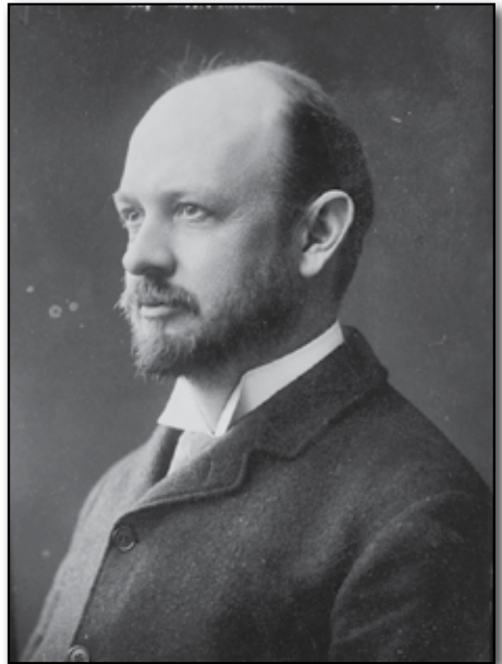
Astronomen William Henry Pickering.

En daglig morgontidning i Göteborg som gavs ut under åren 1896–1950. Tidningen drev flera framgångsrika kampanjer, bland annat för att bygga Göteborgs frihamn, Naturhistoriska museet och stadens första flygplats Torslanda. Under de första åren hette tidningen enbart Morgon-Posten.