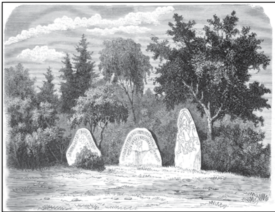
Runstenssamlingen i Marsvinsholms park, Skåne.