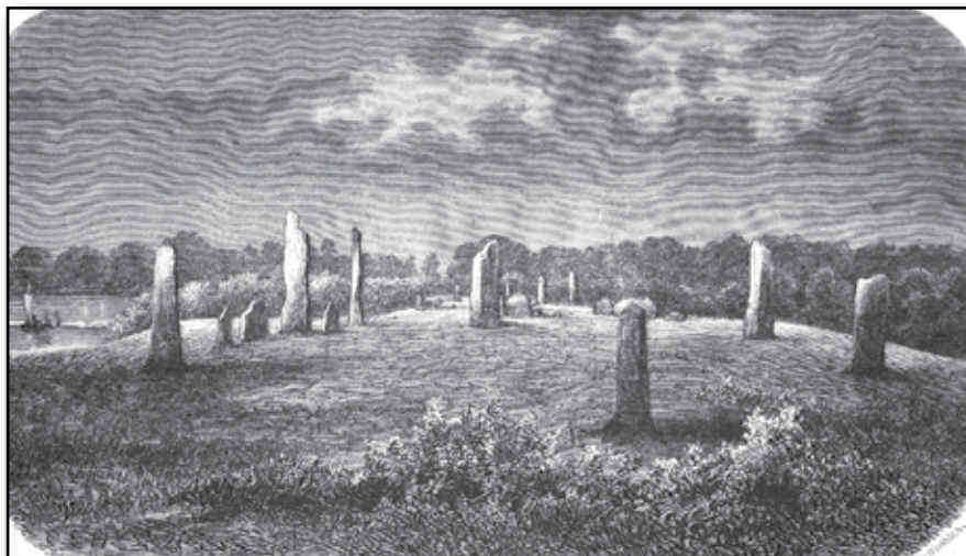
Bautastenar vid Hjortehammar i Blekinge.