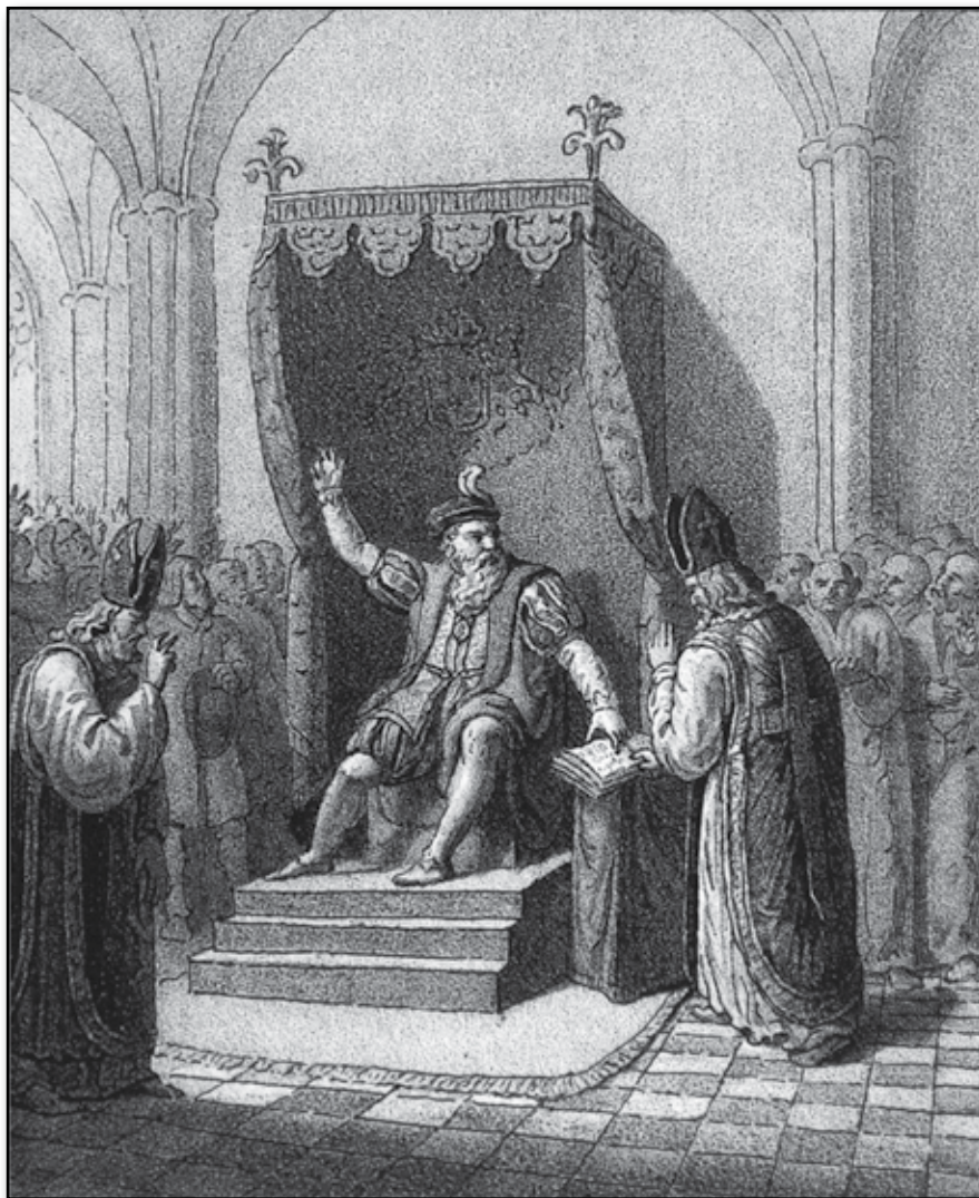
Gustaf Wasa omwänder Catholikerna.