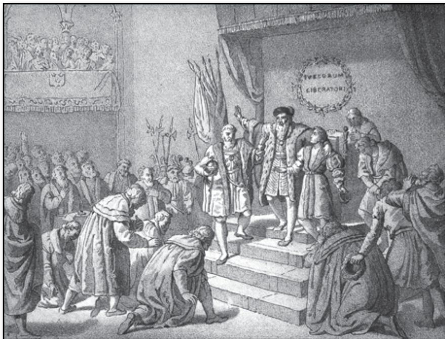
Konung Gustafs sista tal till Rikets Ständer.