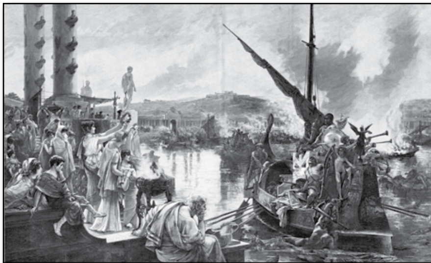
Sjöfäktning i en romersk cirkus. Af R. de Villodas.