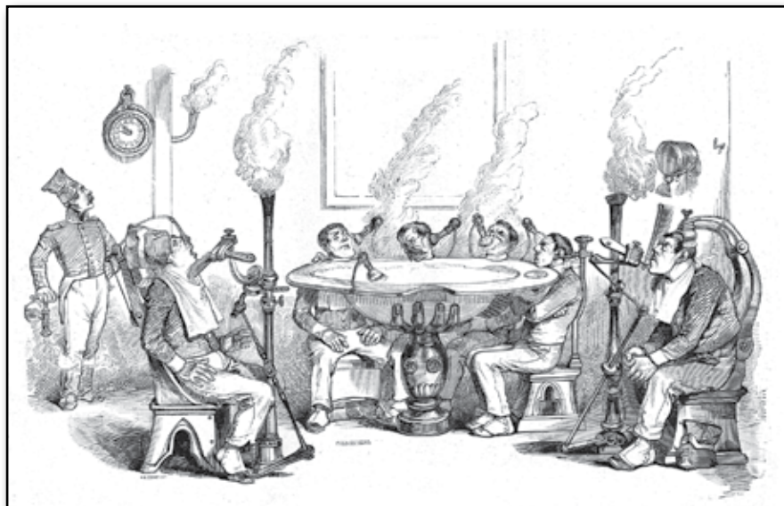
Sex skägg på fem sekunder.