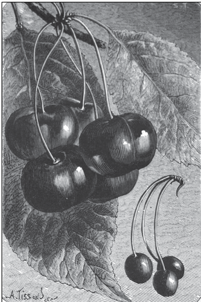
Odlade och vilda körsbär.