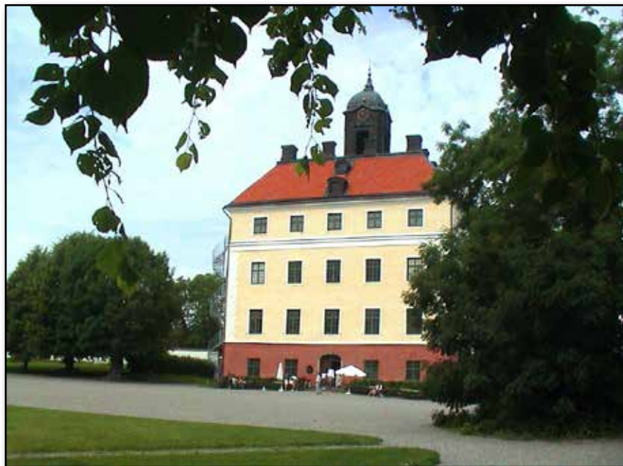
Engsö slott som det ser ut i dag.