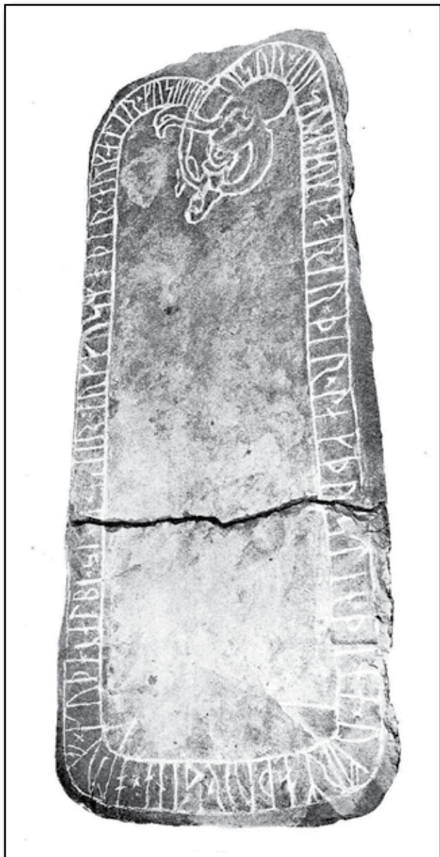
Kinnefjerdings härad. Husaby kyrka.