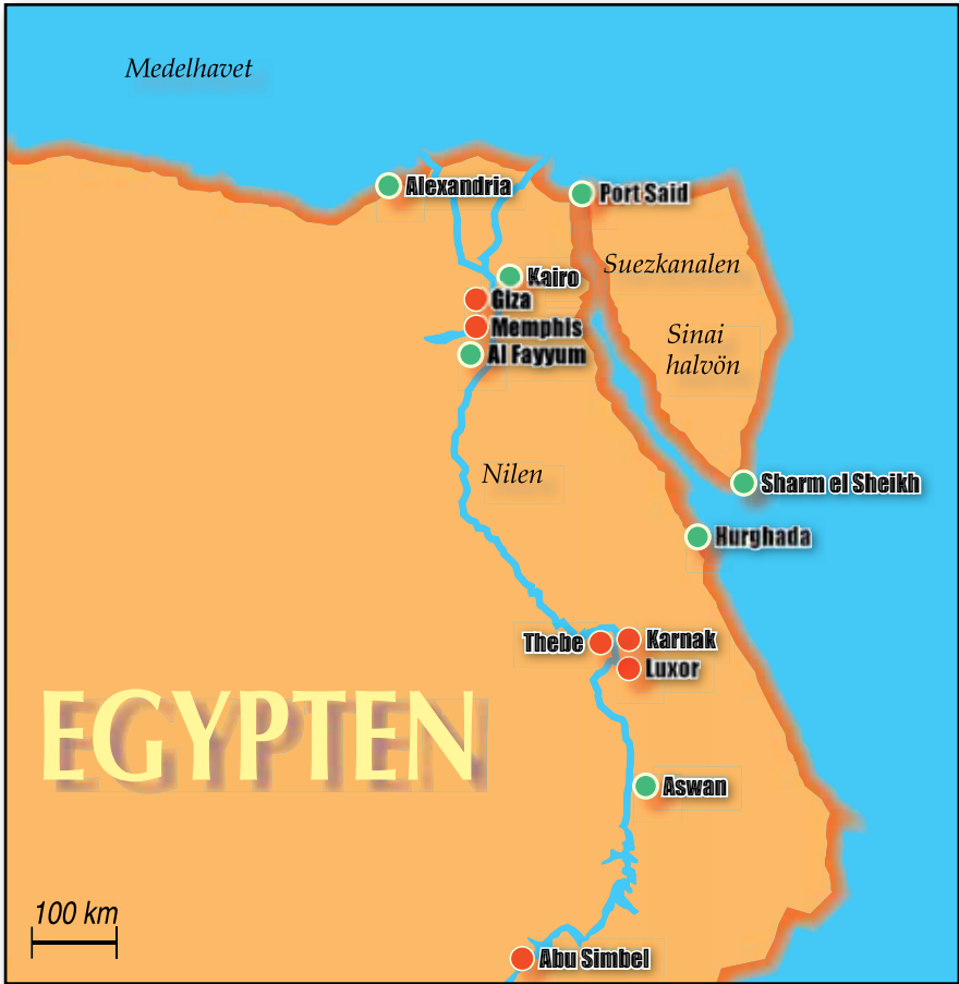
Karta över moderna Egypten.