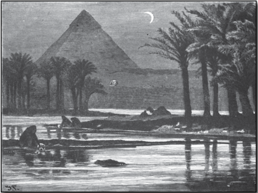
Cheops pyramiden vid Gizeh.