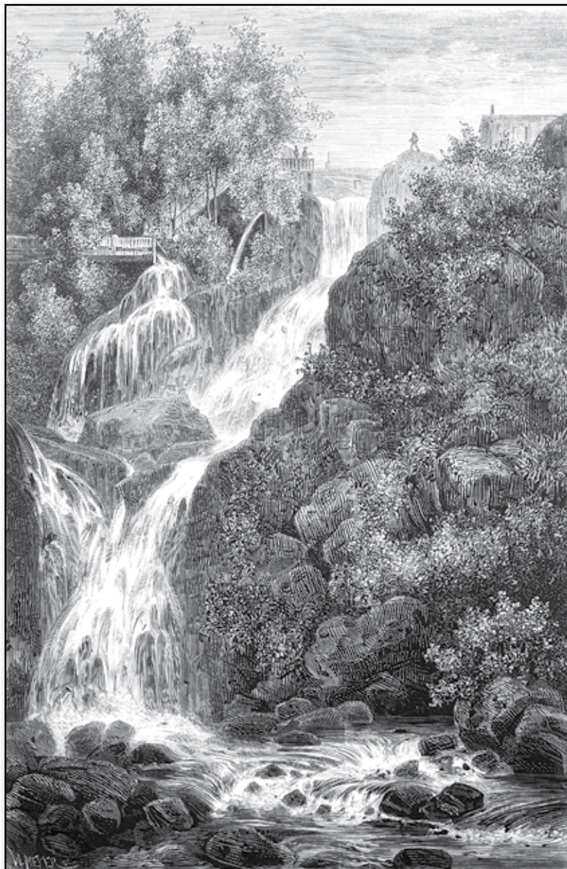
Öfre vattenfallet i Dunkehalla-ån. (Teckning af C. S. Hallbeck.)