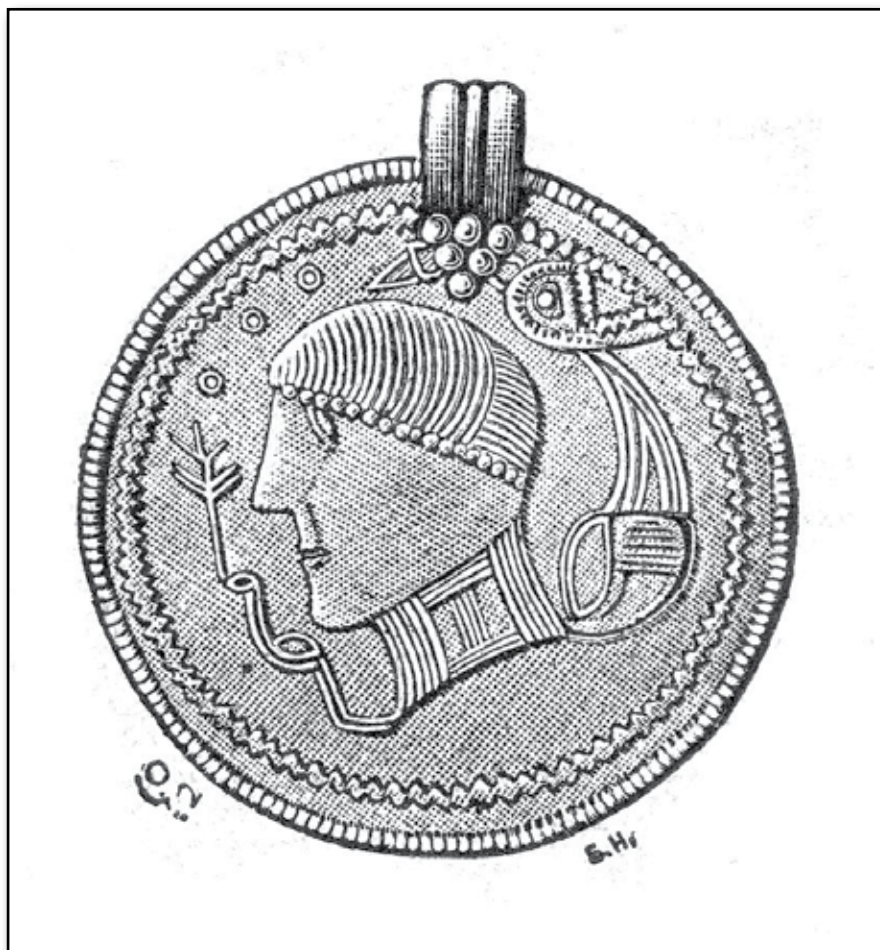
Figur 1. Från Gotland.