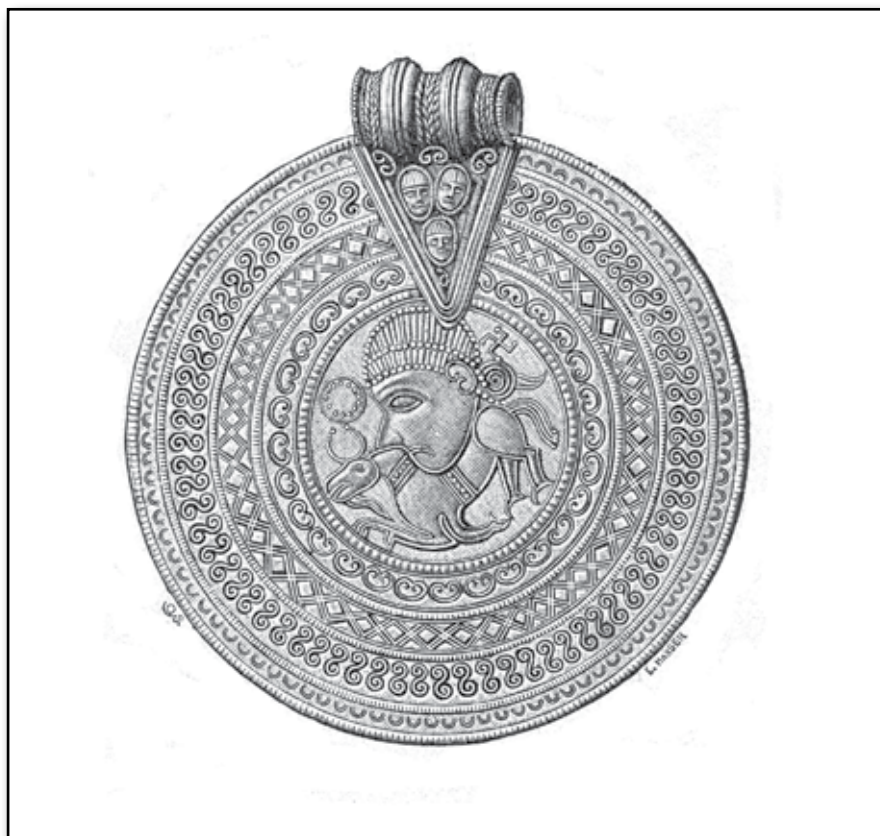
Figur 4. Från Vestergötland.