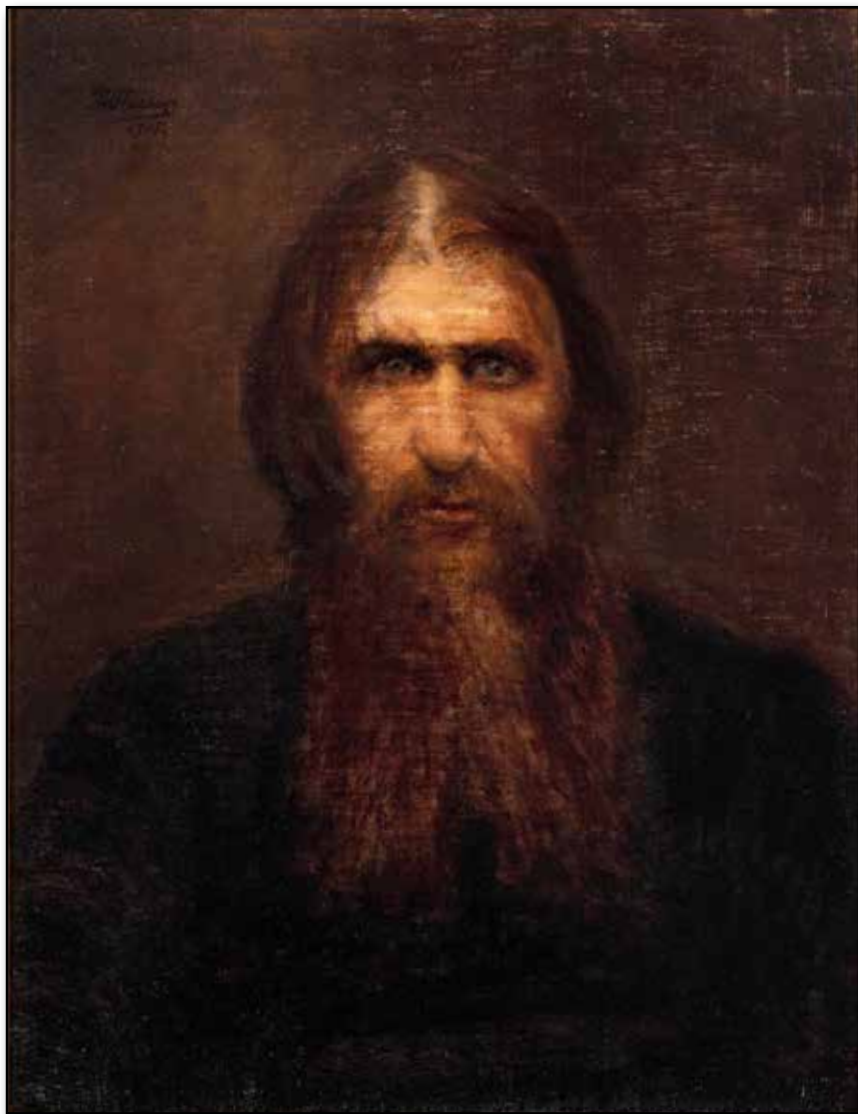
En av danska målarinnan Theodora Krarups porträtt.