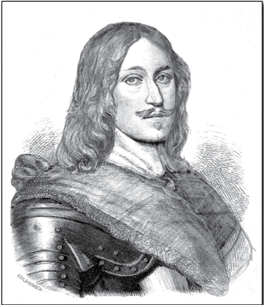
Magnus Gabriel De la Gardie.