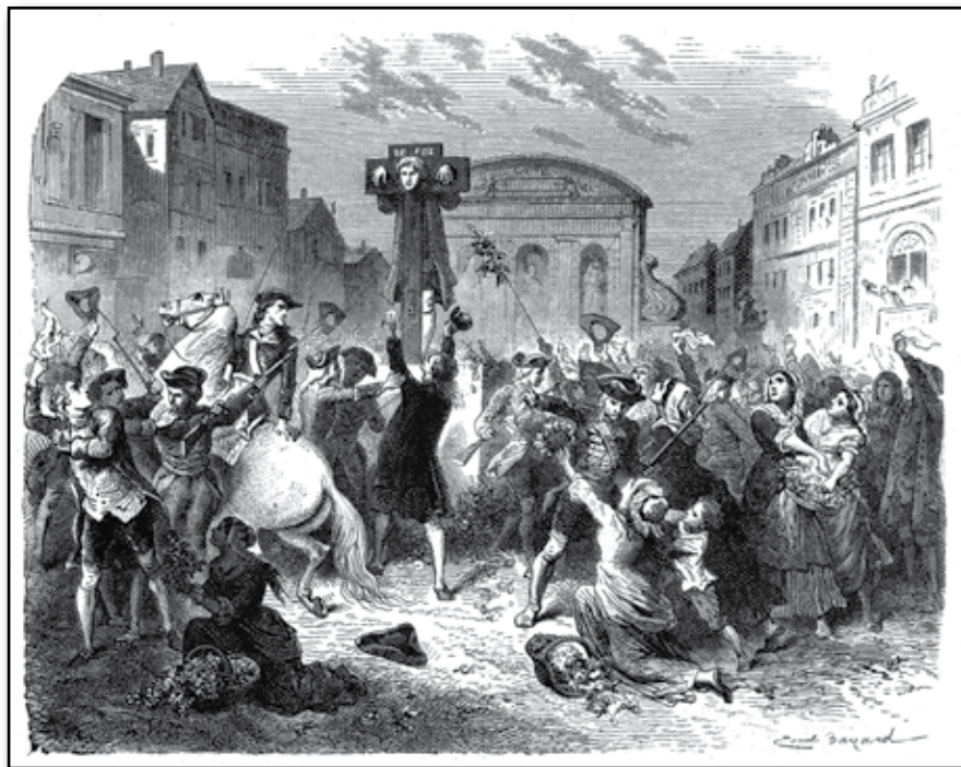
Daniel Defoe på skampallen.