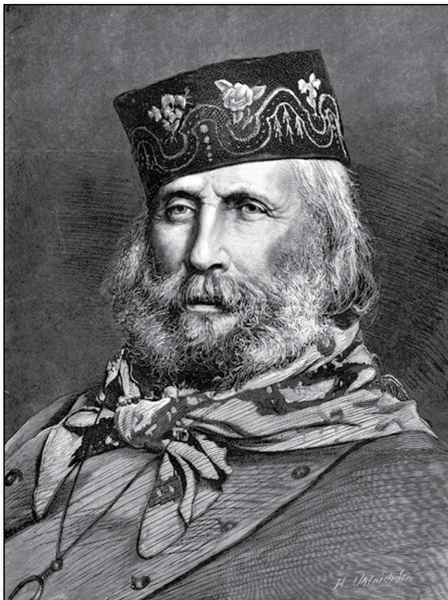
Guiseppe Garibaldi. Född i Nizza den 4:de Juli 1807. Död på Caprera den 2:dre Juni 1882.